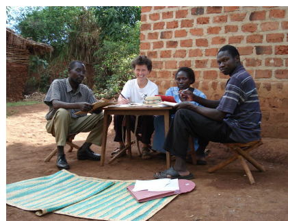
Erfahrungsaustausch mit den Leitern des Internationalen Jugendclubs '08

Dies gegenseitige Verständnis gilt in besonderer Weise auch für den Briefaustausch von Schülern der Realschule Radolfzell und dem Internationalen Jugendclub in Buleega. Neben der Verbesserung der englischen Sprachkenntnisse erzählen die Schüler von ihren Familien und vom alltäglichen Leben in ihrer Heimat.