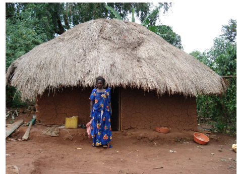
Auch hier soll eine Solarlampe Licht in die Hütte bringen. Eine wichtige, aber auch schwierige Aufgabe.

Die Buma ist ein gemeinnütziger Verein, der die Entwicklung in den Dörfern Buleega und Makindu vorantreibt. Dazu gibt es eine Buma-Gruppe im Dorf und eine mit Akademikern wie Prose in der Stadt Kampala. Wir haben hier kompetente und zuverlässige Partner gefunden. Wir hoffen, das Projekt bis im Dezember 2009 abschließen zu können.