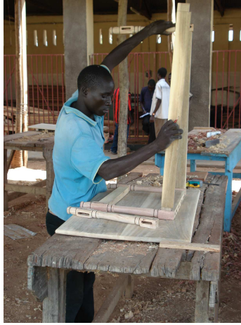
Ausbildung zum Tischler in der Berufsschule Kitgum

Ein großer Dank geht an die Spender. Einen Großteil der Spenden haben wir für die Rehabilitation ehemaliger Kindersoldaten weitergeleitet. Der Krieg ist vorbei, die Narben heilen langsam. Wolfgang und Birgit Schwarzmeier waren beeindruckt von der positiven Aufbruchstimmung in Kitgum/altes Kriegsgebiet und geschockt von der depressiven Stimmung in manchen Lagern im Januar 2008.